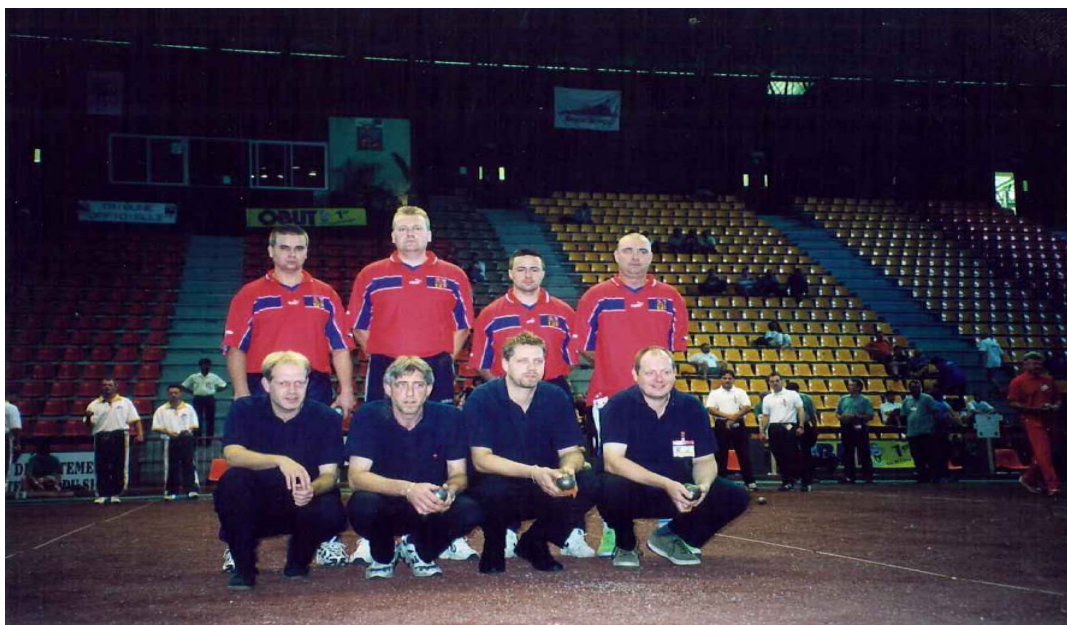
Norge - Tsjeckia