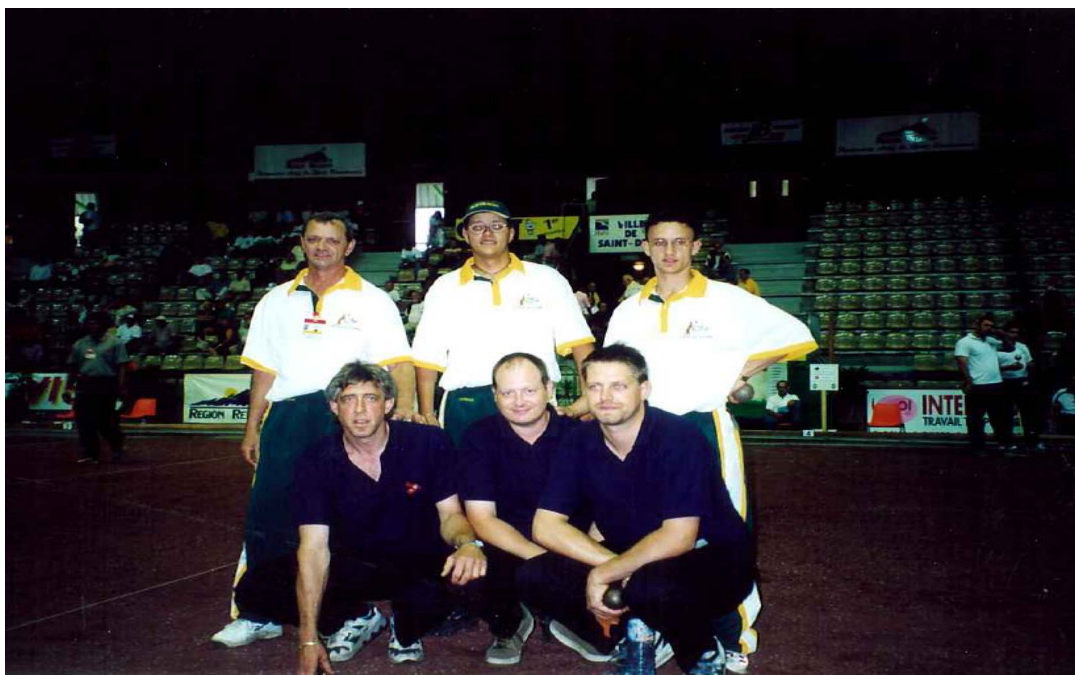
Norge – Australia