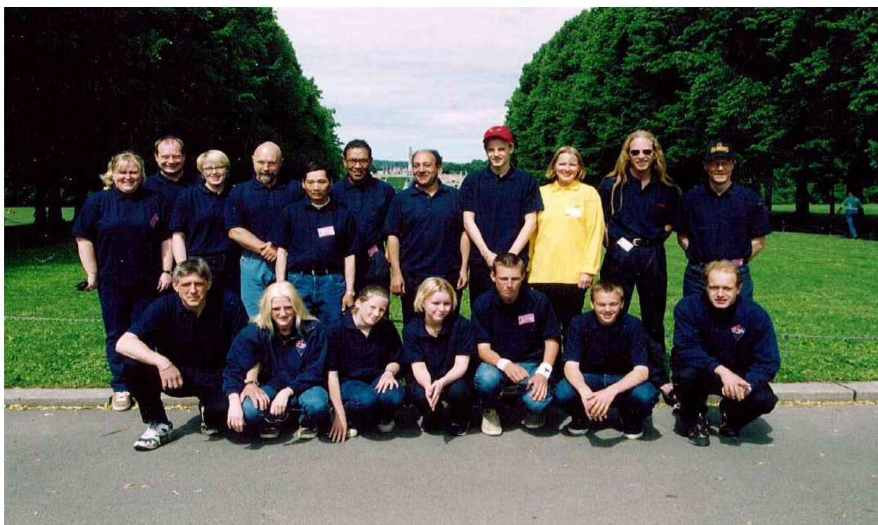
Den norske troppen til mesterskapet