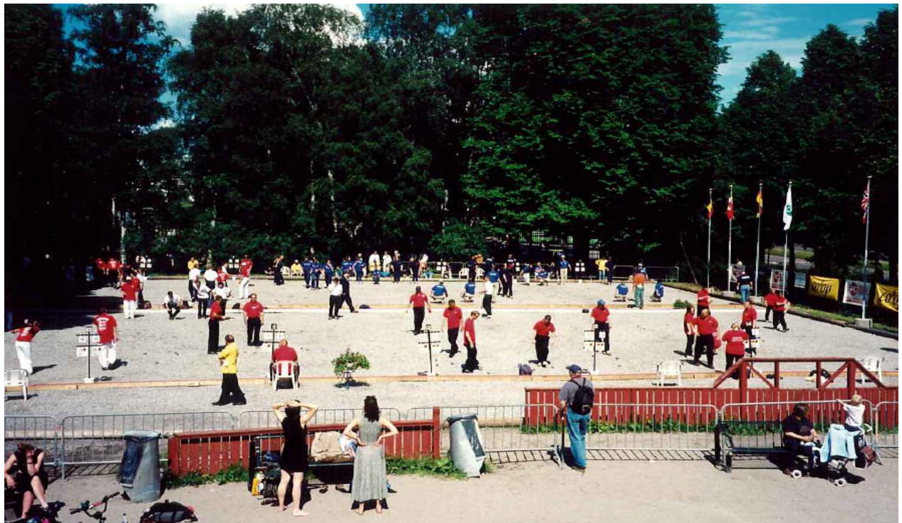
Ny bane i parken til mesterskapet