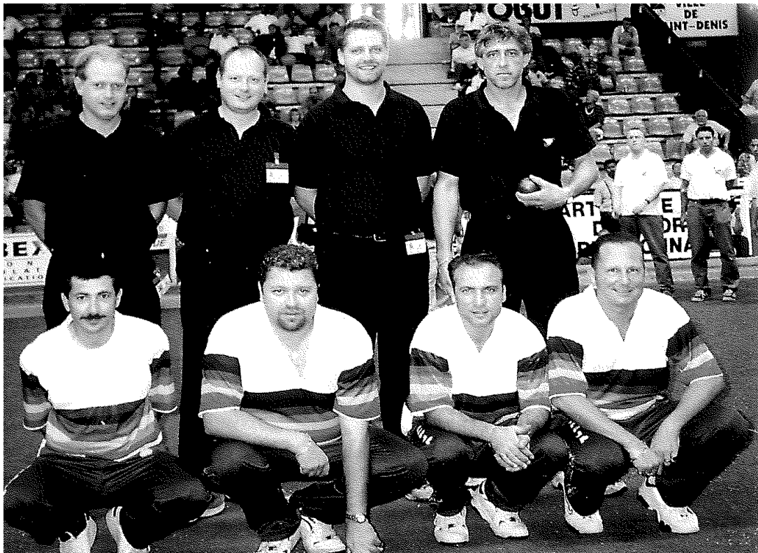
Norge – Frankrike II