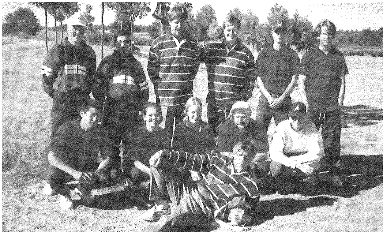
Norges tropp til Nordisk Mesterskap i 1995