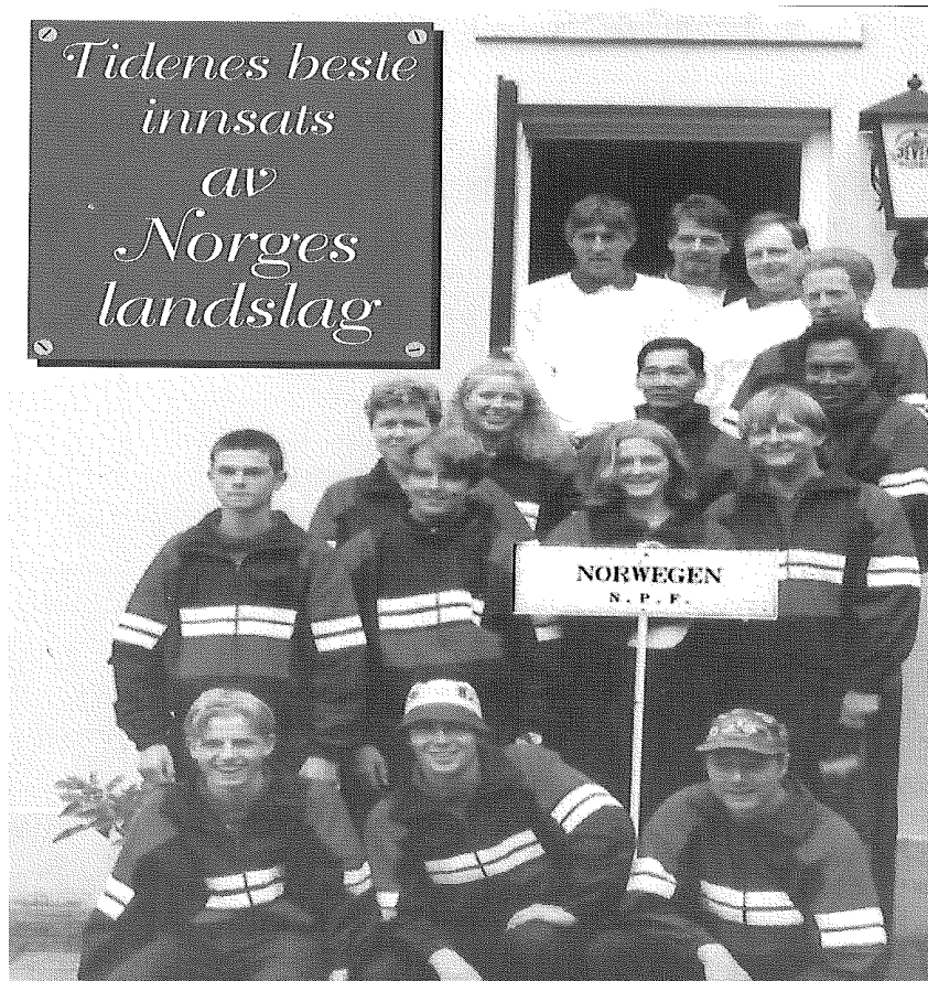
Norges landslag Nordsjø Wilhelmshaven I 1995

Juniorene vant tre kamper, og i disse kampene spilte de norske juniorene god petanque.