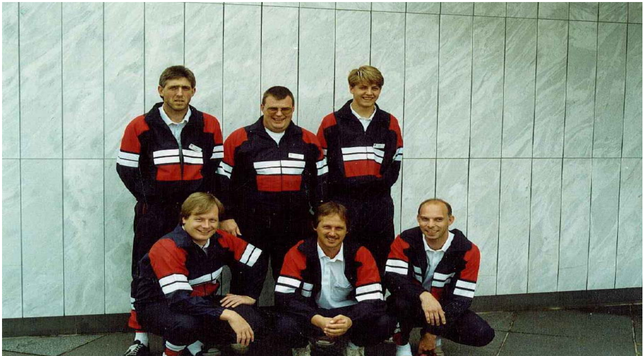
Norges lag i åpen klasse