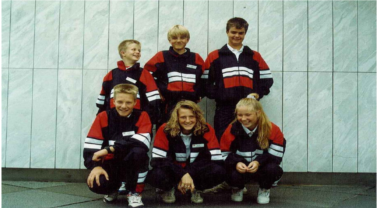
Juniorlagene til Nordisk i 1992