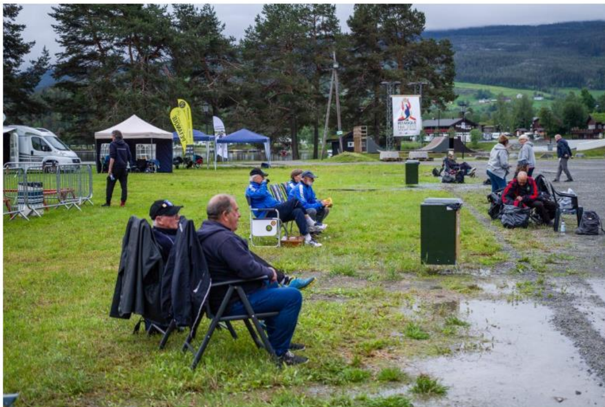
Innafor: Det er vått men absolutt ikke kaldt i Fagernes torsdag formiddag.