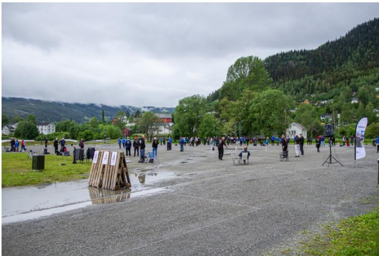
Minst: De minste klassene starter torsdag, det er derfor ikke flust med liv denne dagen. Men fredag, og ikke minst lørdag hvor den største grenen spilles, vil alle banene være i bruk hele dagen.