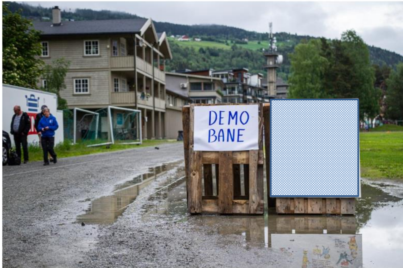
Prøve selv: Er man nysgjerrig på spillet i praksis er det lagt opp demobane som er bemannet hele tiden, slik at man kan teste ut selv.