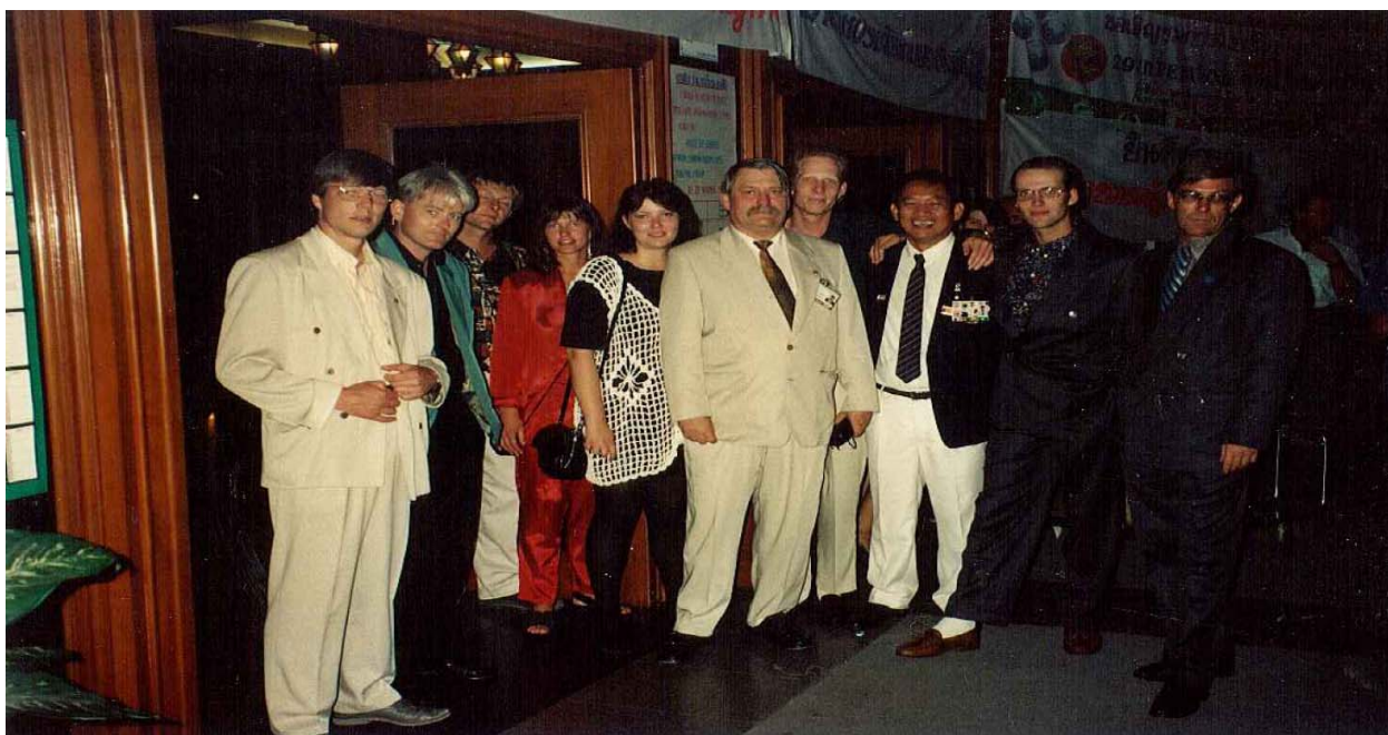
VM laget med ledere