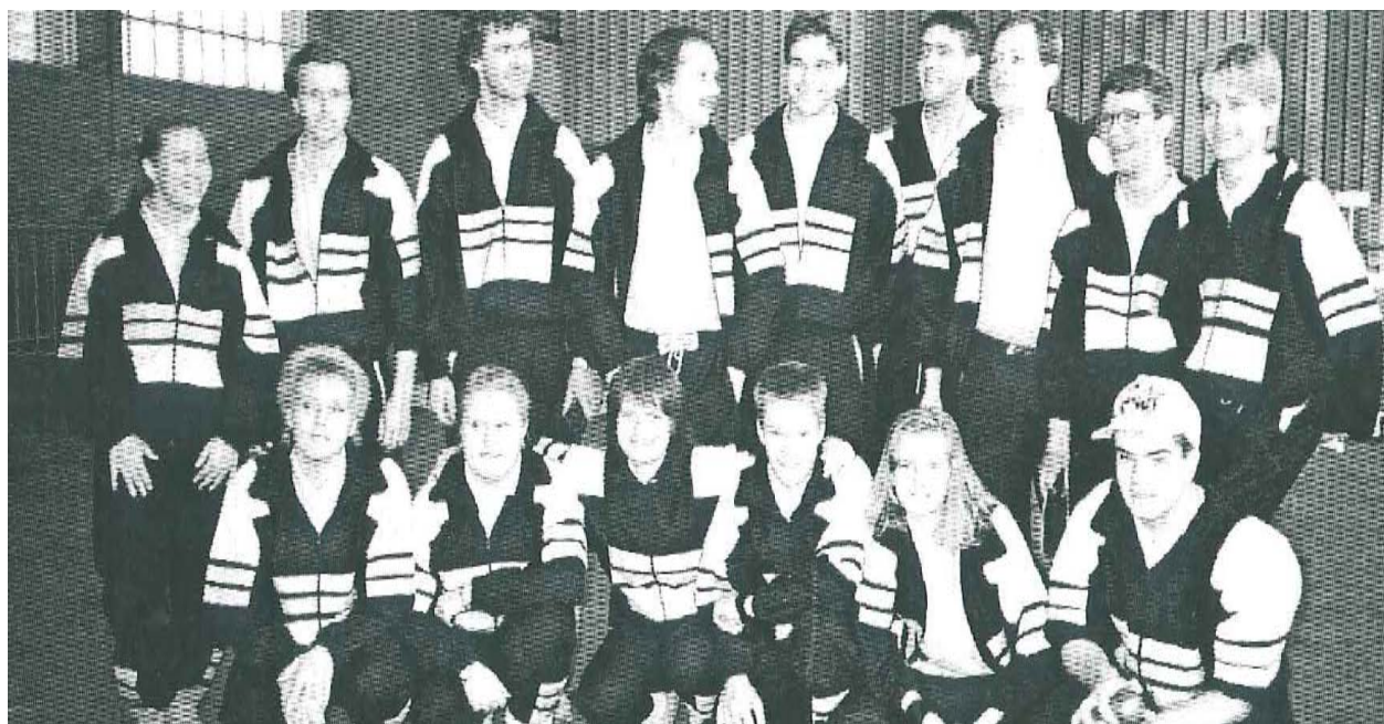
Troppen til Nordsjø

Etter årets Nordsjøturnering kunne vi reise hjem fra Ostende, Belgia, med 17 seire i bagasjen. Enn eneste seier skilte oss fra 5. plassen. Danskene måtte bite i gresset og besatte jumboplassen med 14 seire. Men frem til Belgia var det langt, 52 seire av 60 mulige.