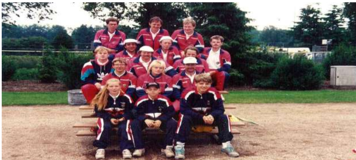
Norges tropp til Nordsjø i 1991