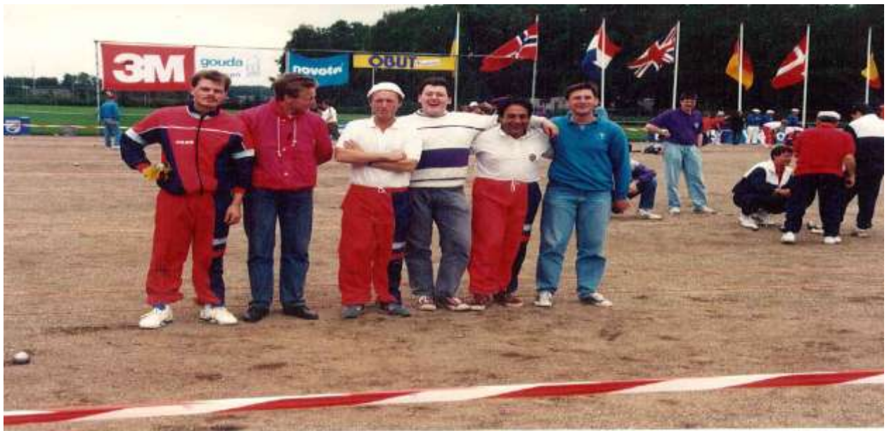
Petanque forbrødring i Nordsjø