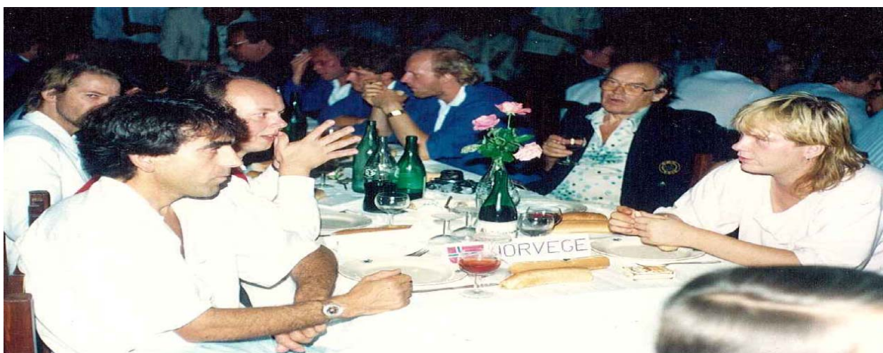
Middag for Norge siden av middagsbordet i VM 87