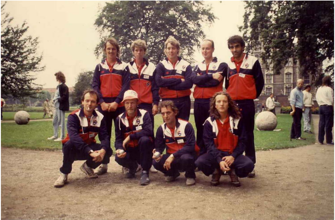
Nordisk Mesterskap og den Norske troppen i 1987