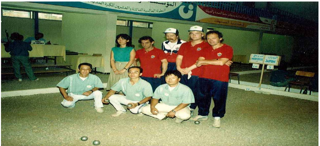
Norge – Japan